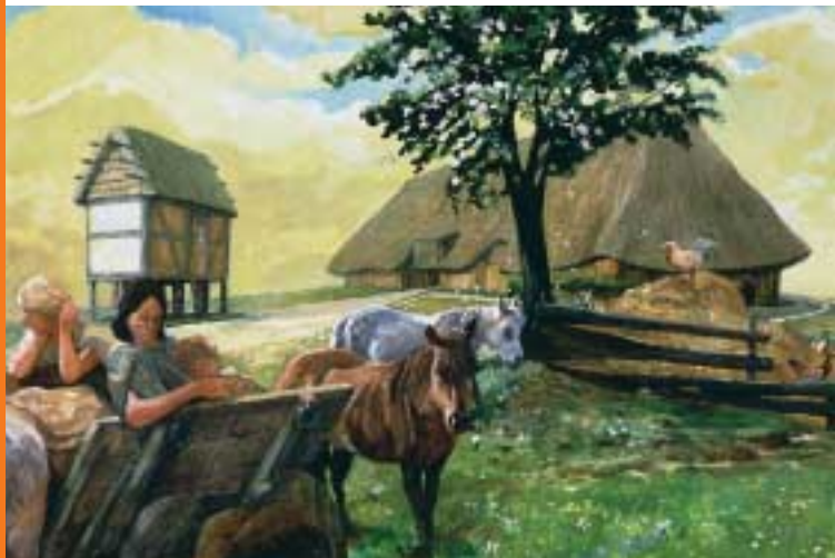
Bataafse boerderij op woerd

Op deze plek ziet u ook weer een typische woerd, Groenoord. Dit hoger gelegen gebied is al sinds de prehistorie bewoond. Het ligt aan de rand van het nieuw in te richten Park Overbetuwe, dat we aanstonds zullen doorkruisen. We zullen een stukje fietsen langs de Linge, een prachtig watertje dat overigens geen Romeinse oorsprong heeft, maar in de Middeleeuwen is aangelegd als wetering.