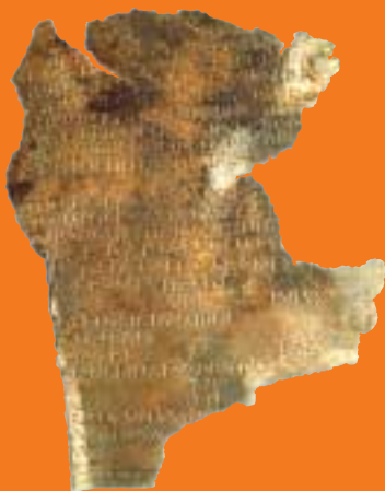
Romeins diploma