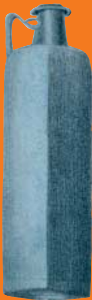
De enige overgebleven Romeinse fles uit de grafvondst van Raayen, getekend in 1844.