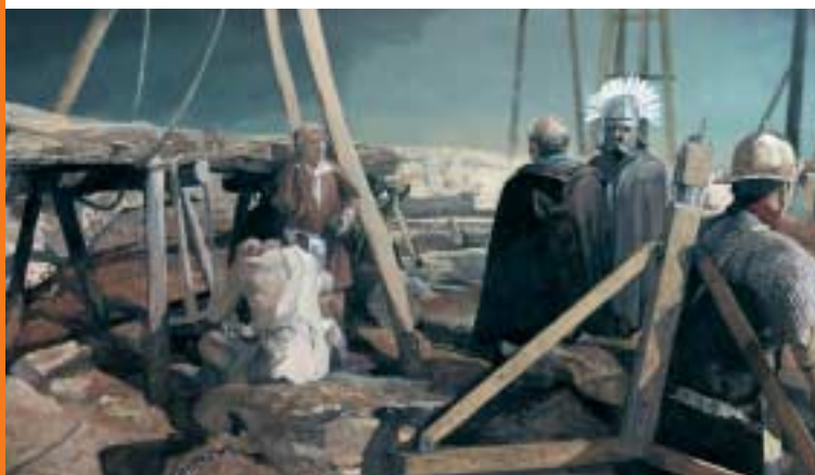
Romeinse bouwplaats

De ruitereenheid waar onze Bataaf bijhoorde, de Ala Batavorum, bestond al aan het begin van onze jaartelling. Tijdens de Bataafse Opstand (69-70) liep de Ala Batavorum over naar de rebellen. Om herhaling te voorkomen werden hulptroepen na de opstand verplaatst naar gebieden ver buiten het eigen stamgebied. Onze Bataafse diplomahouder, wiens militaire avontuur begon in het jaar 74, heeft dus verre streken gezien, al weten we niet welke. Zijn diploma geniet tegenwoordig internationale bekendheid door de erop vermelde lijst van hulptroepen in Neder-Germanië (Germania Inferior), de provincie waartoe ook Overbetuwe behoorde. Het diploma is te bewonderen in Museum Het Valkhof in Nijmegen.