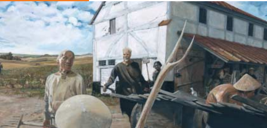
Bataafse boerderij, uitgegroeid tot Romeinse villa