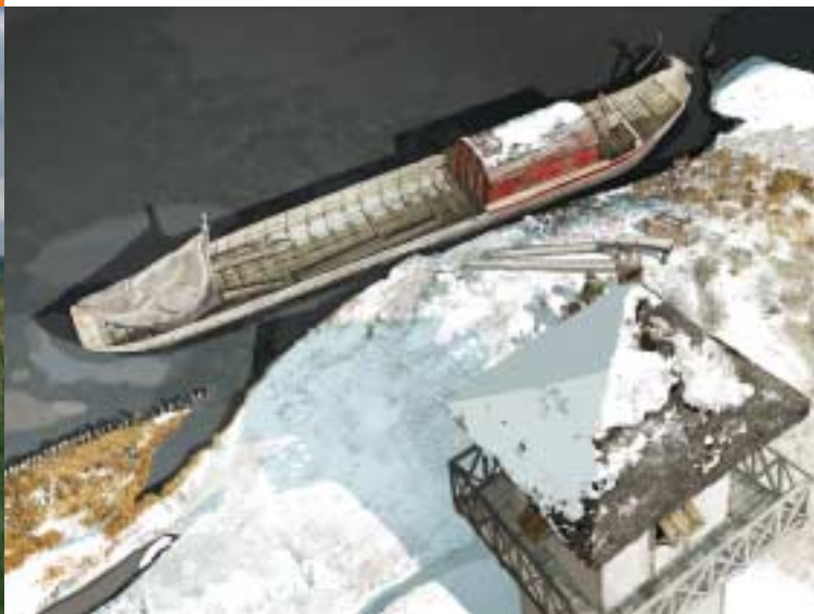
Typische Romeinse Rijnaak