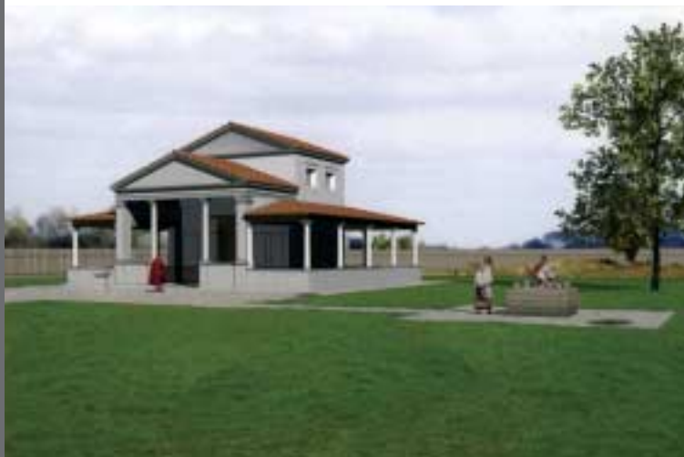
Tempel en waterput rond het jaar 100