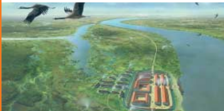
Reconstructie van een castellum aan de Rijn

Volgens archeologen zou er tussen de Romeinse forten in Arnhem-Meinerswijk ( Castra Herculis ) en Kesteren ( Carvo ) nog een castellum moeten liggen. De meest logische plek is Randwijk, omdat het strategisch tegenover twee beekdalen in de Veluwe ligt.